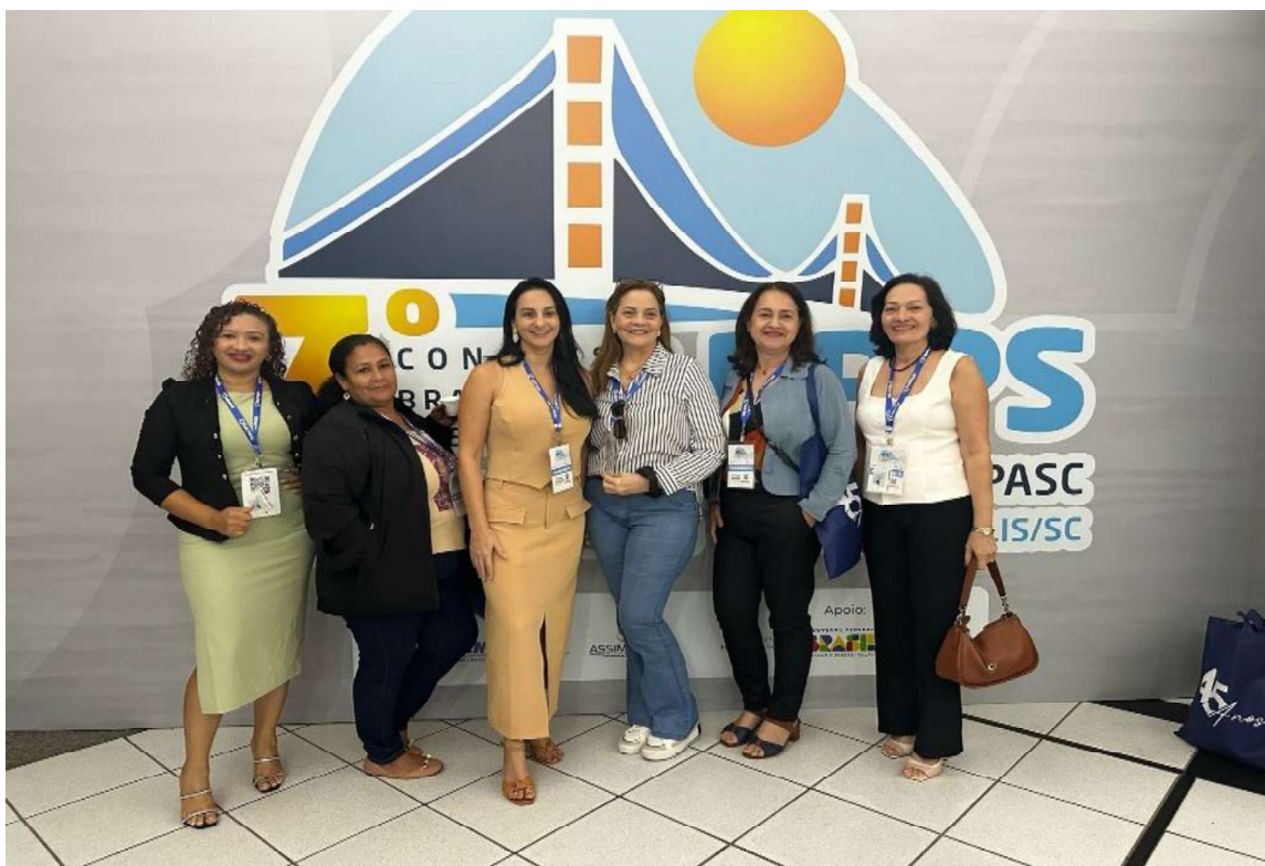
Figura 5 - 7º Congresso Brasileiro de Investimentos