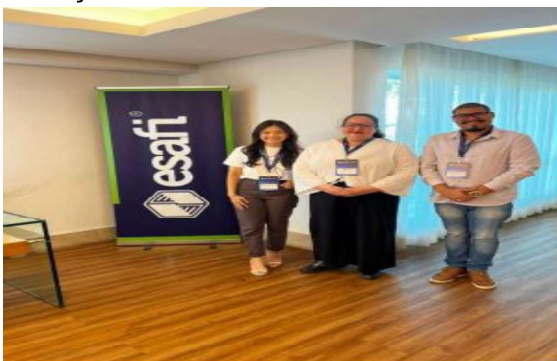
Figura 2 - Curso Completo sobre a Nova Lei Geral de Licitações Públicas - Lei 14.133/2021