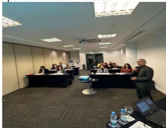
Figura 3 - Curso sobre Regime Previdenciário do Servidor Público e Cálculo de Aposentadorias e Pensões