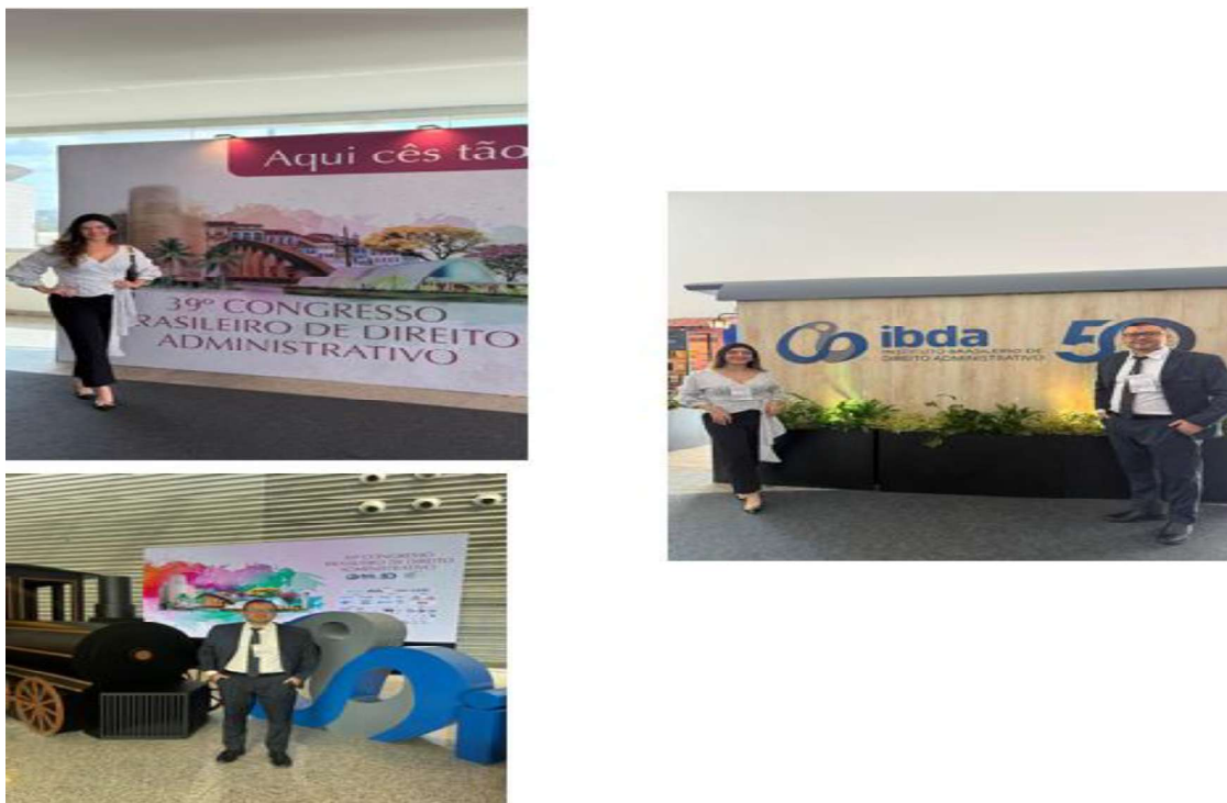
Figura 4 - 39º Congresso Brasileiro de D-ireito Administrativo