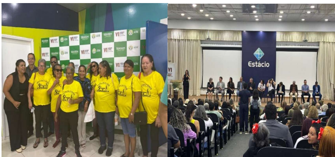
Figura 10 - Conferência Estadual da Pessoa Idosa