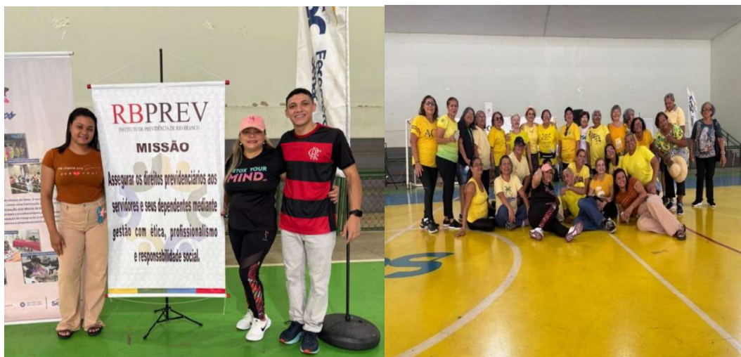
Figura 11 - Evento “Envelhecer com Dignidade”

Evento “Envelhecer com Dignidade” parceria RBPREV, SASDH, SESC, com caminhadas, lanche e dança, realizado em 26 de setembro de 2025, nas dependências do SESC/AC.