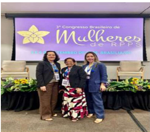
Figura 7 - 3º Congresso Brasileiro de Mulheres de RPPS