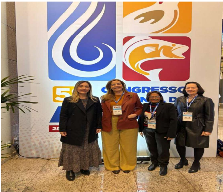
Figura 6 - 58º Congresso Nacional Abipem