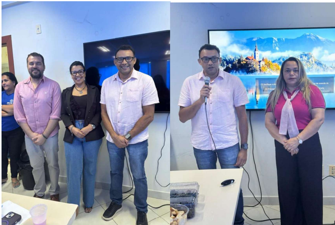
Figura 9 - Palestra Educação Financeira