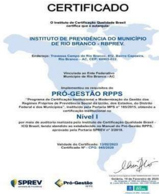
FIGURA 5 – CERTIFICADO DO PRO-GESTÃO

O Instituto de Previdência do Município de Rio Branco- RBPREV, com objetivo de cumprir a missão de assegurar os direitos previdenciários aos servidores efetivos e seus dependentes, mediante gestão participativa com ética, profissionalismo e responsabilidade social, recebeu em 2020 a certificação do programa de Gestão de Qualidade, através da metodologia do PRÓ-GESTÃO - Programa de Certificação Institucional e Modernização da Gestão dos Regimes Próprios de Previdência Social. O processo de certificação proporcionou benefícios internos e externos à organização. Externamente, eleva a credibilidade e aceitação perante outras organizações com as quais se relaciona e, no âmbito interno, a certificação auxilia na organização e melhoria dos processos da instituição, diminui o retrabalho, reduz custos e alcança maior eficiência e racionalização do uso dos recursos