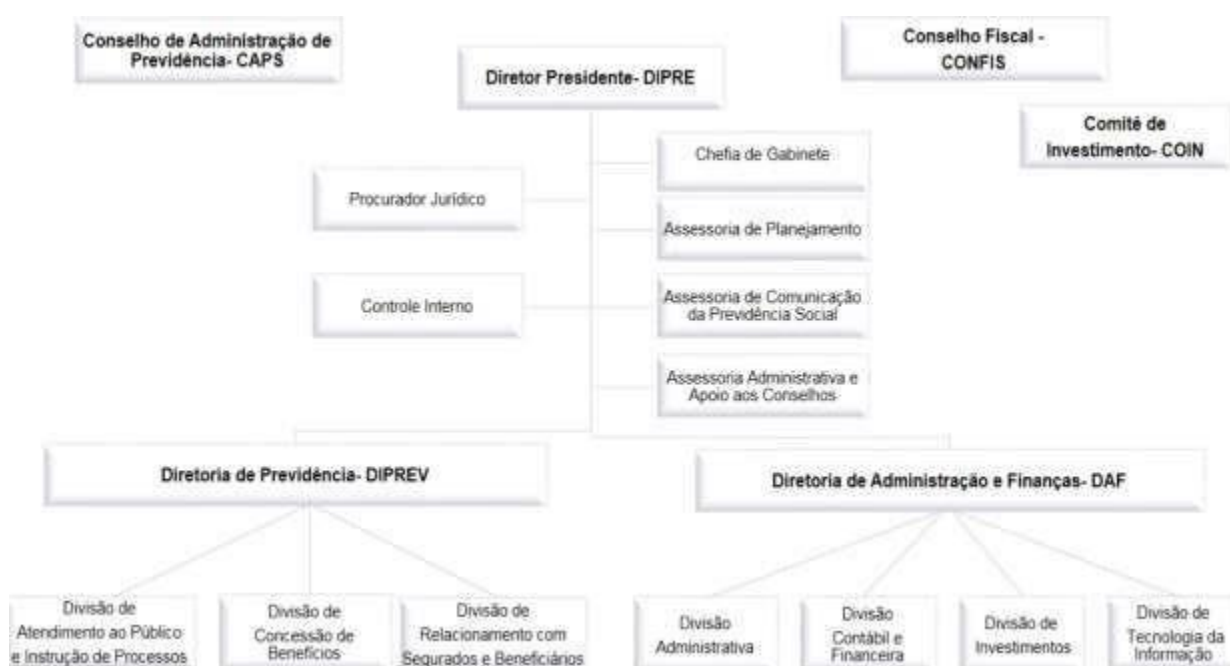
FIGURA 02 – ORGANOGRAMA DA ENTIDADE