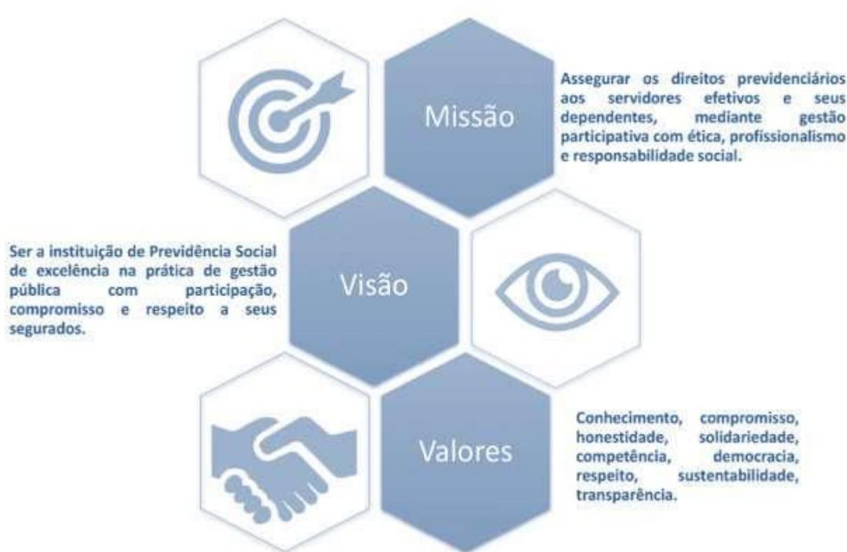
FIGURA 01 – CONCEITOS FUNDAMENTAIS DA ENTIDADE RBPREV