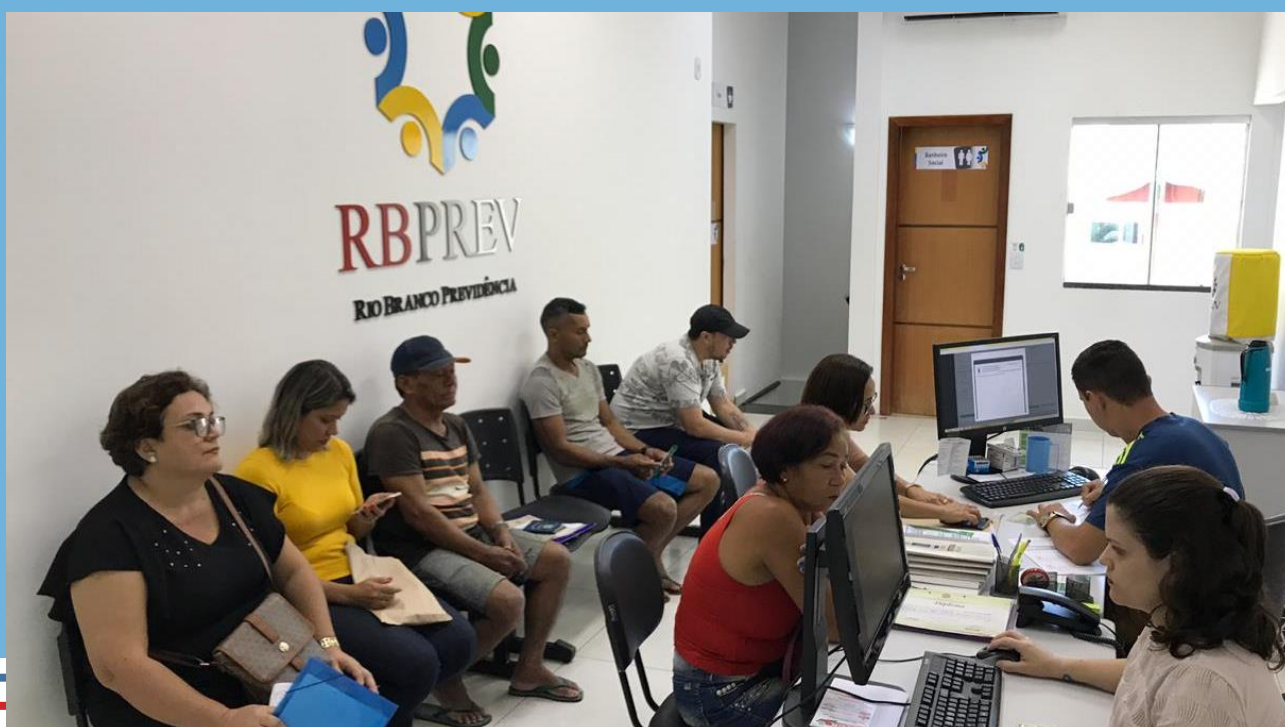
Atendimento de servidores no Recadastramento.

▶ O Recadastramento Previdenciário é uma ação do Município de Rio Branco voltada para atualizar a base de dados dos servidores efetivos, objetivando validar os dados pessoais e profissionais, além de coletar informações sobre os dependentes dos servidores para a realização do Estudo Atuarial, estudo técnico que estabelece, de forma suficiente e adequada, os recursos necessários para a garantia dos pagamentos previdenciários.