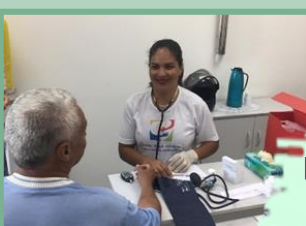
Palestra Planejamento Financeiro Pessoal