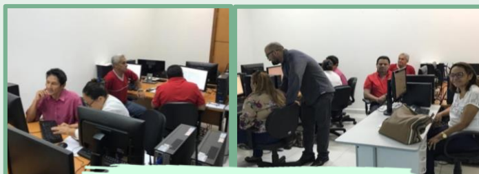
Curso de informática básica