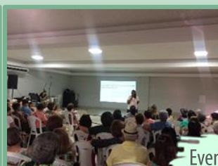
Evento em parceria com o SESC