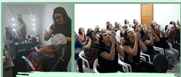
Evento em comemoração ao mês da mulher